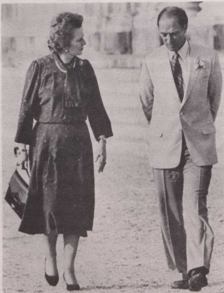
El Primer Ministro Trudeau (derecha) y la Primera Ministra británica Margaret Thatcher paseando por los jardines de Versalles.