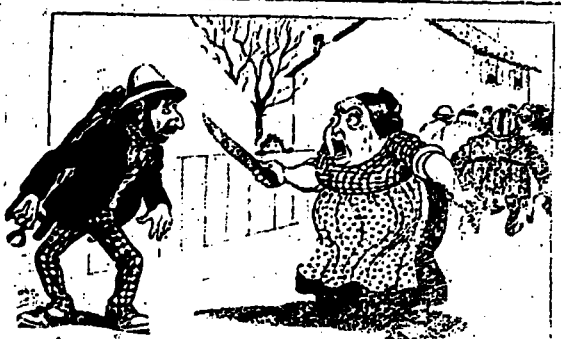
LA VIEILLE.—Etes-vous sourd ? Il y a une heure que je cours après vous. Aff'ez-donc ce couteau.

Tel. Bell : 1915. JARDINS D'ETE. RESTAURANT des GOURMETS -60 Rue St-Gabriel SALONS PRIVÉS et spécialité pour DINERS et SOUPERS SUR COMMANDE Ouvert jusqu'à minuit. On porte à domicile. de 7 à 8 hrs du matin Déjeuner : Chocolat. FRED. DUBOIS.