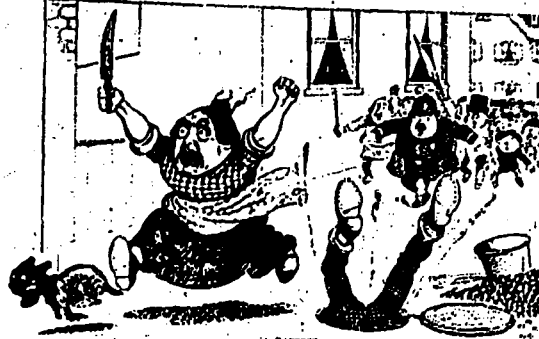
LA POLICE.—Arrêtez-la ! tuez-là !