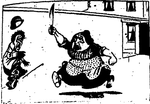
LA VIEILLE.—Aïe ! Aïe ! Aïe !

Prenez le Sirop et les Bonbons de PIN PARFUME pour les Rhumes