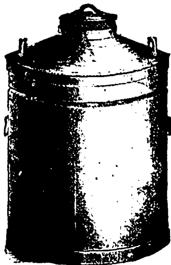
CANISTRE A LAIT "EMPIRE STATE."