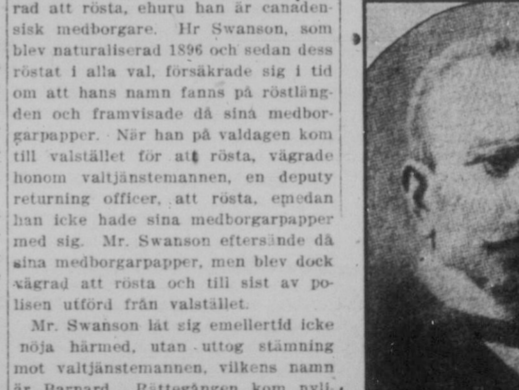
Hjalmar Hammar skjöld

I Posttidning meddelas, att Svenska akademien med sin höge beskyddare konungen bifall den 23 maj i följande efter framlidne f. statsrådet Per von Ehrenheim till ledamot valt och kallat förre statsministern, landshövding Hjalmar Hammar skjöld. Några litterära förtjänster har den nya medlemmen av de aderton vetenskaperna inte tillfäkt för utmärkelser. Varken hans skriftställarskap på den svenska bolagsrättens område, hans fadersförhållande till noten till presidenten Wilson och den underliga kommissionen i Luxemburgsaffären eller hans vittalighetsprov i Karolinska förbundet torde få betraktas som följande goda specimen för en plats i den vettra aeropagen. Svenska akademien har vid sitt val säkerligen letts av