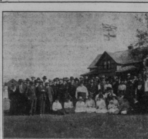
En del av deltagarna i fästet.

På annat ställe omtalas, att de gamla settlarna i Wetaskiwin-distriktet, Alta, firade 25-årsjubileum på Dominiondagen, den 1 juli. Fästet blev enligt rapport till S. C. T. synnerligen lyckad. De gamla svenska pionärerna i distriktet deltog mangrant och avlade vittnesbörd om de strapasor och svårigheter, de i nybyggartiden måst genomgå. Nummer tredje detta distrikt räknas till ett av de mest välbergade svenska settlementen i Canada, o. de gamla kunna säkerligen glädja sig ö. över allehanda materiel framgång. Men