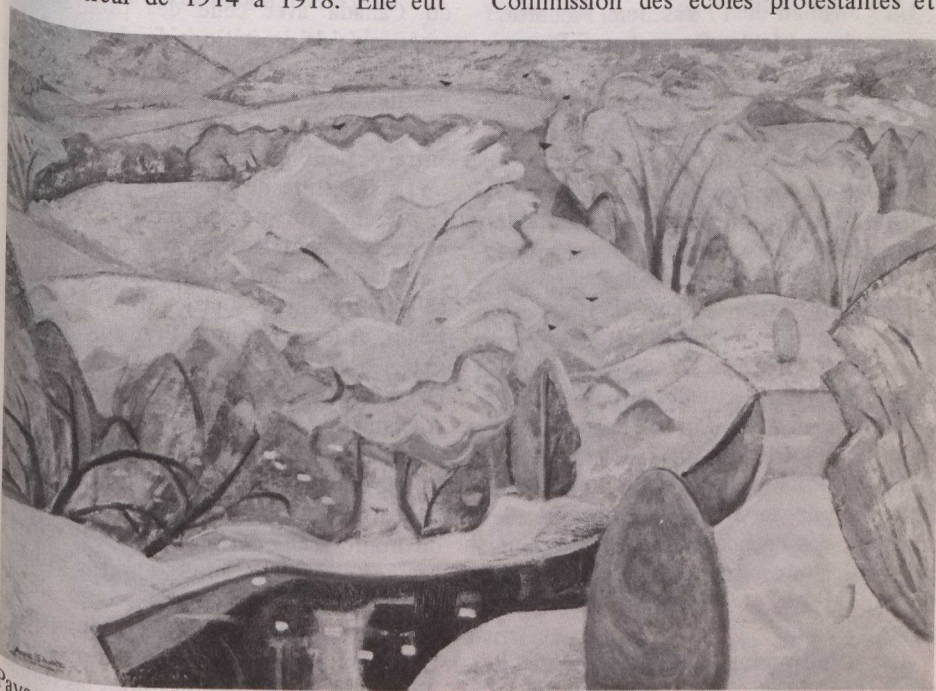
Paysage laurentien, Anne Savage, huile sur toile, vers 1960.

Écrivains et poètes ont exploré la frontière entre le sacré et le profane, fait la part de l'héritage occidental et de l'héritage oriental. Ils se sont aussi demandés si les poètes modernes suivaient la trace des prophètes d'antan.