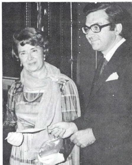
Mme Rina Lasnier, gagnante du Prix David 1974, en compagnie du ministre des Affaires culturelles du Québec, M. Denis Hardy.

Le Prix David, instauré en 1922 par M. Athanase David, alors secrétaire de la province, constitue la plus haute récompense littéraire accordée par le Gouvernement du Québec.