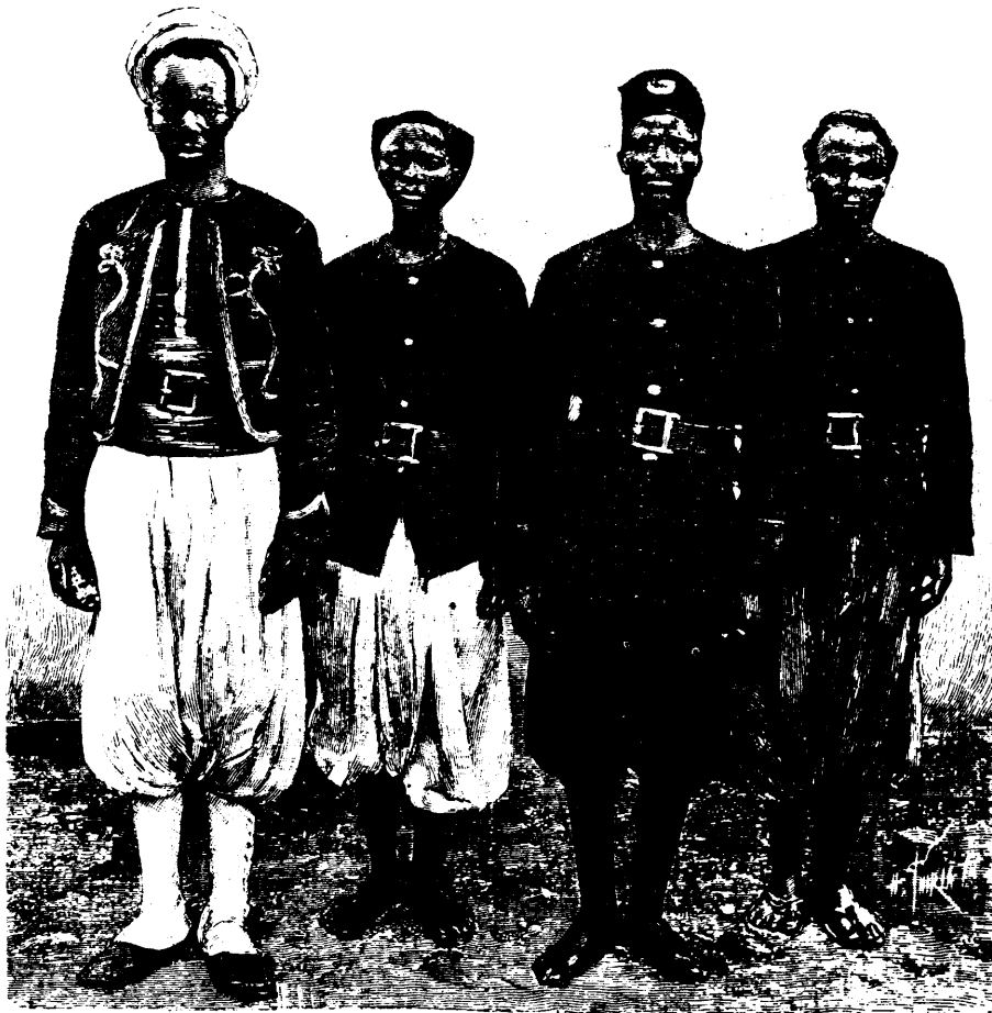
Tirailleur sénégalais. Tirailleur haoussa. Garde civil. Volontaire sénégalais.

Tarif spécial pour annonces à long terme