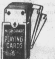
EGY teljes sorozat kártyáért