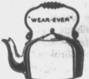
TIZ teljes sorozat kártyáért