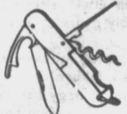
KÉT teljes sorozat kártyáért