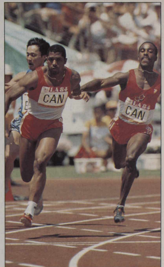
Jeux olympiques de Los Angeles