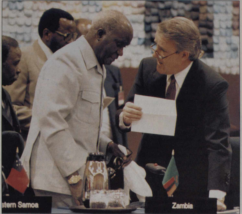
Le Président Kaunda et le Premier ministre Mulroney — Sommet du Commonwealth — Vancouver