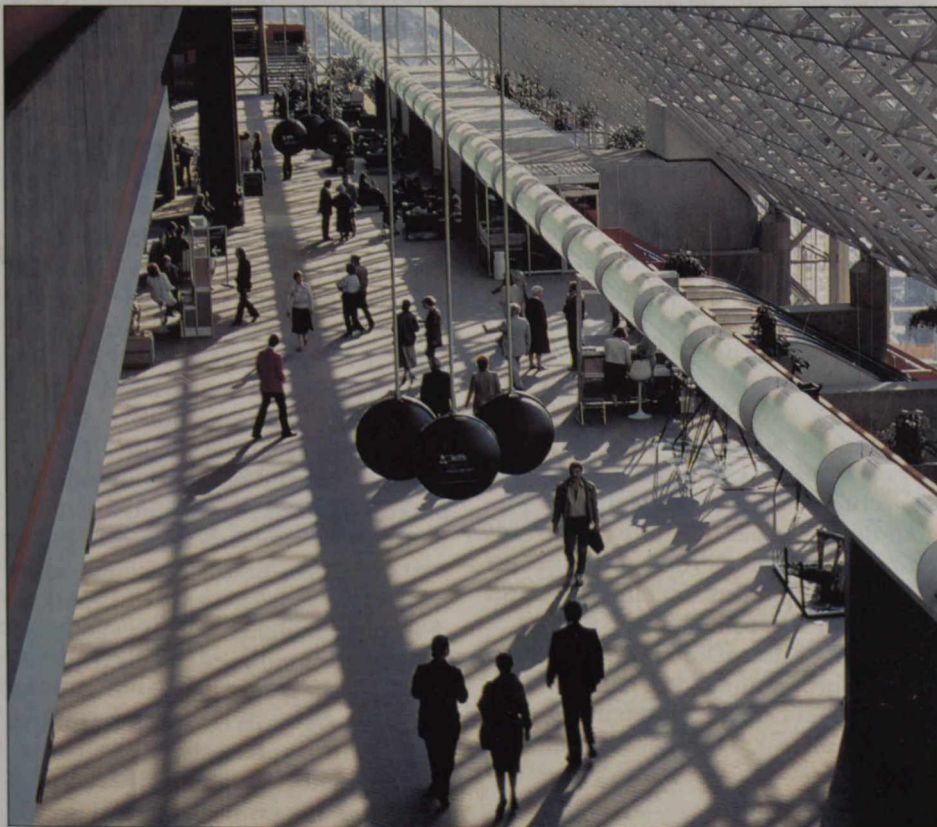
Palais des Congrès de Montréal