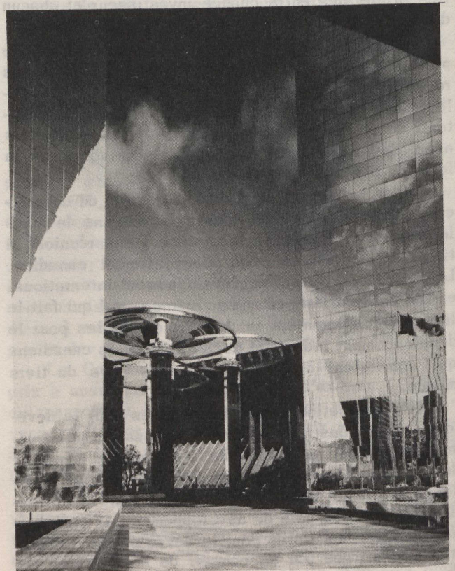
Une des entrées de la cour intérieure.

commerciale internationale de Tokyo en 1965, le prix de l'Institut du béton précontraint en 1966 et en 1967, et le Vancouver Citation Award en 1965 et 1966.