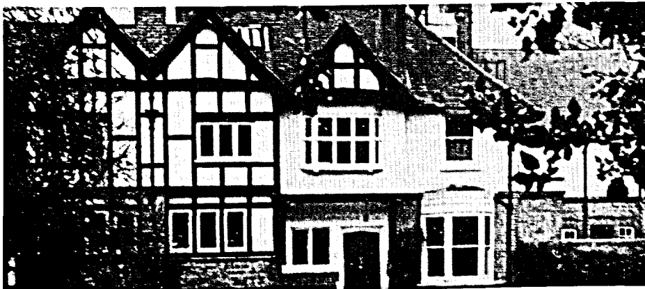
École canadienne à Woking (Surrey) au sud-ouest de Londres.

des excursions à Londres et à la campagne, des expériences pratiques, par exemple la rédaction d'articles de presse, le jardinage alpin, ainsi que des sports, comme le judo, les exercices aérobiques, le tennis et le soccer. Les frais de scolarité sont plus élevés que dans les écoles britanniques, mais moins qu'à l'école américaine. Ils vont de 1 300 livres pour les enfants qui fréquentent la maternelle toute la journée à 3 300 livres pour les élèves de la 9 e à la 13 e années. Pour plus de renseignements, prière de s'adresser à Mairi McElhill, Canadian Schools Abroad, Janoway Hill Lane, St. John's Road, Woking, Surrey, GU21 1PF — téléphone: (04862) 71990, ou à l'agent chargé de l'éducation à la Section des relations communautaires, Centre des services à l'affectation (ADTB) — téléphone: 992-2221.