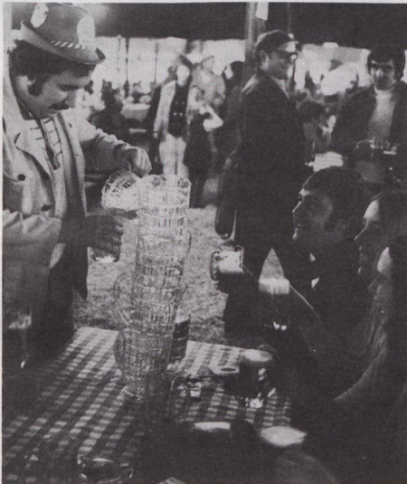
Las cervecerías son el sello distintivo de los Oktoberfest.

El único Oktoberfest en las Marítimas es el de la bahía Mahone, ahora en su tercer año. Las celebraciones duran cuatro noches en esta villa de Nueva Escocia de