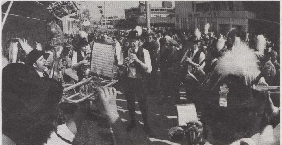
Las bandas callejeras son parte del Oktoberfest de Kitchener-Waterloo.

La versión del Oktoberfest de Oakville, Ontario, es la más antigua de la provincia y este año celebrará su XX aniversario. Dura una sola noche y se celebra en el "Festhall" de 1.200 localidades. Conjuntamente con la música de bandas de bombardino y el concurso de Miss Oktoberfest, la fiesta está realizada por los