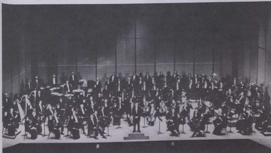
L'Orchestre symphonique de Montréal en concert.