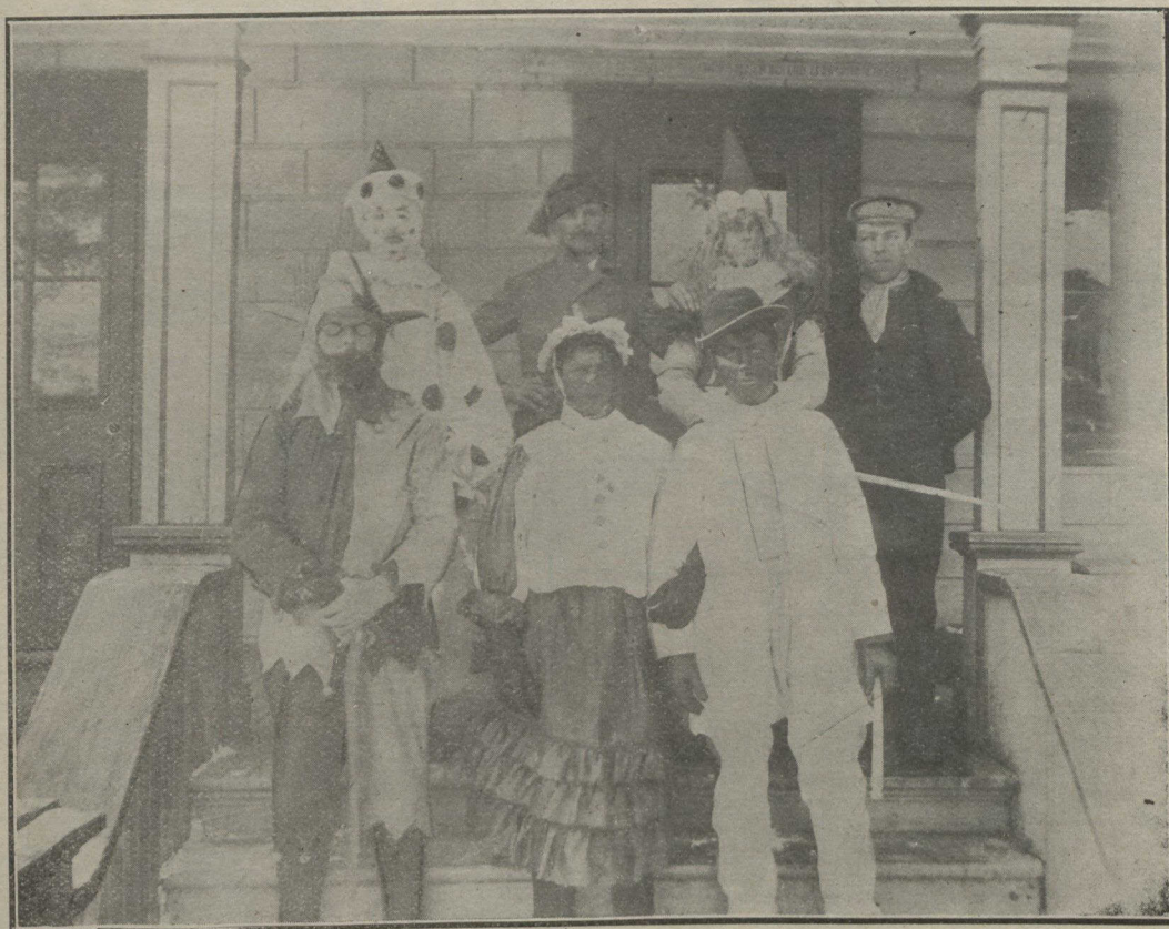
Scène typique photographiée spécialement pour l'Album Universel, par M. P. D. Manseau, à l'entrée d'un hôtel bien connu du public montréalais, et situé tout juste à dix milles de Montréal.

Aussi, dit-il volontiers en plaisantant :