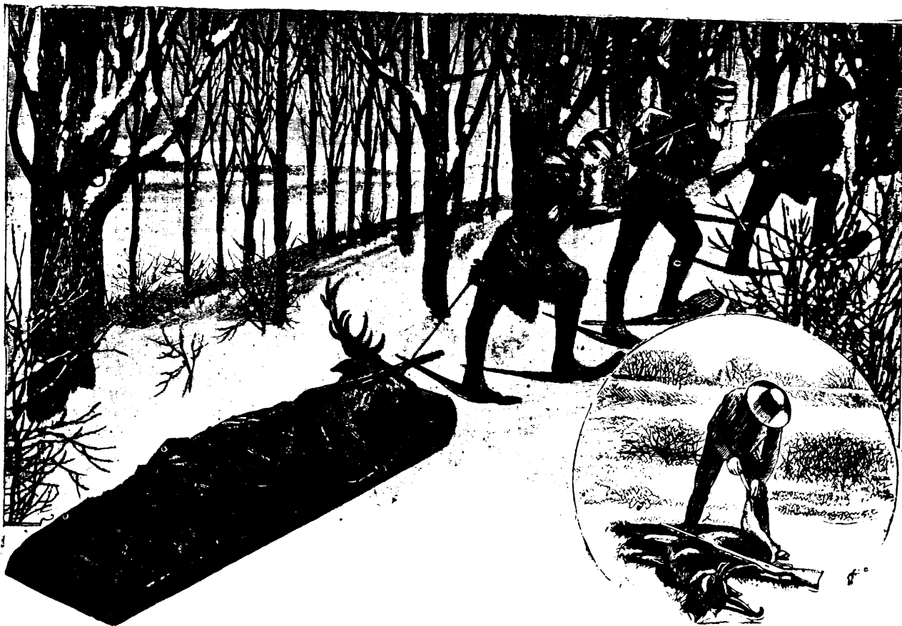
UNE PARTIE DE CHASSE AU NORD-OUEST