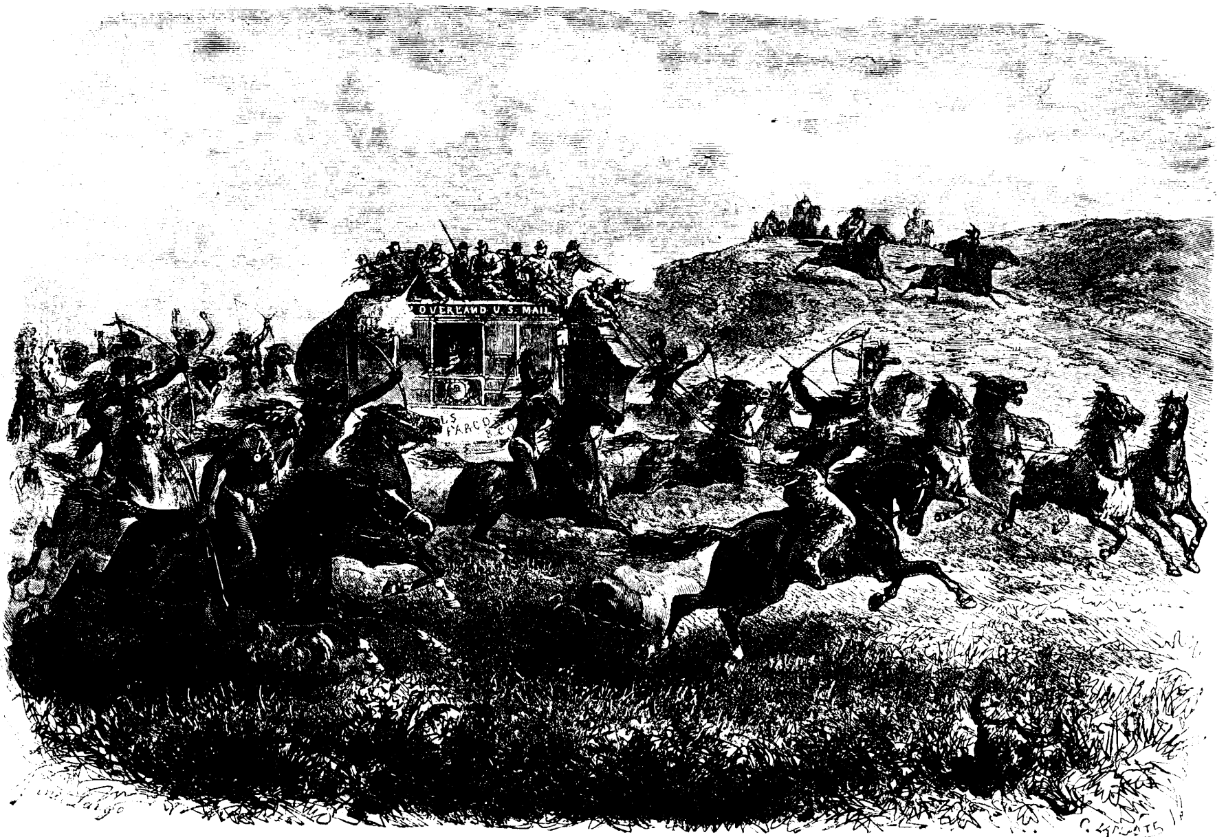
ATTAQUE D'UNE DILIGENCE DE LA MALLE PAR DES INDIENS