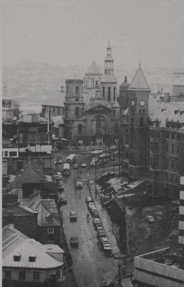
Veduta aerea di una strada di Quebec con sullo sfondo la Cattedrale.

plesso moderno dove la parte residenziale e quella commerciale riescono a convivere in armonia.