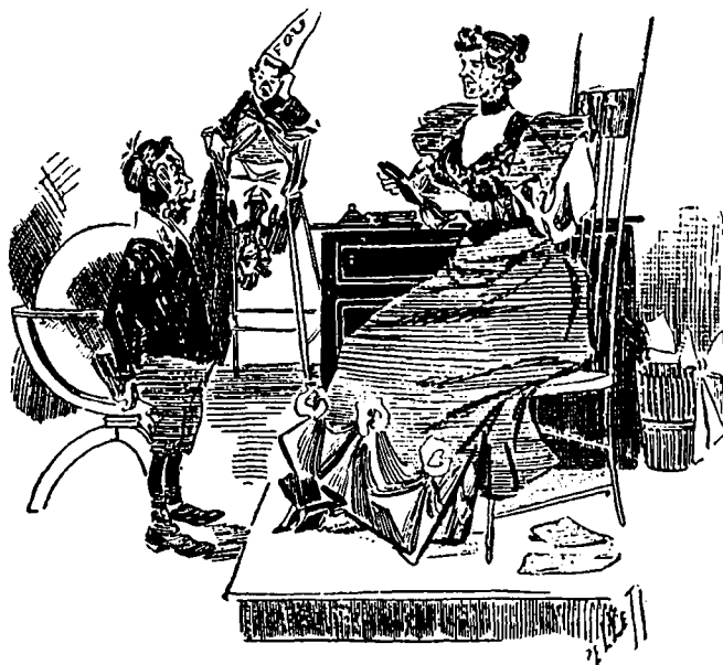
L'institutrice. — Quels sont les fondateurs de Rome? L'élève. — Roméo et Juliette.

A part l'opération chirurgicale, la hernie n'a pas de traitement curatif; la contention par le bandage herniaire est le seul appliqué en général comme palliatif.