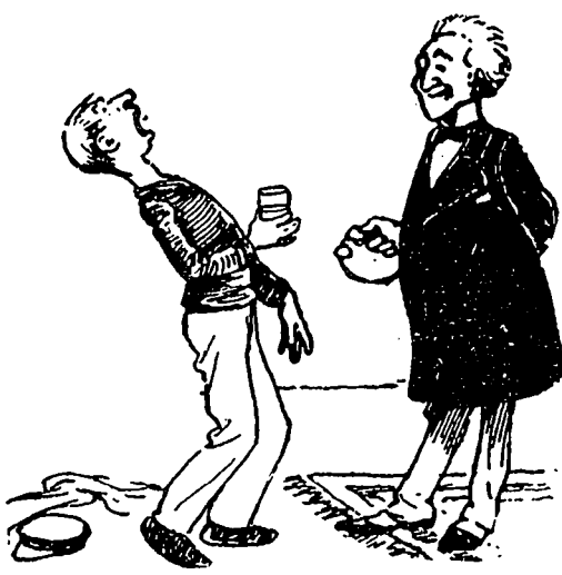
II —Penchez-vous en arrière et gargarisez-vous avec cette liqueur.