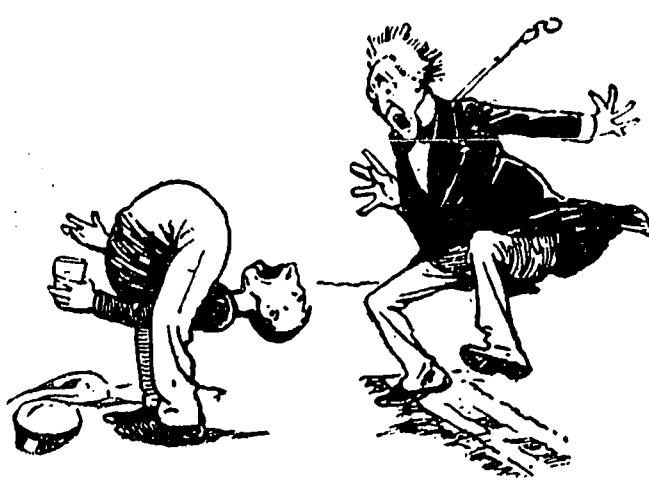
IV —Est-ce assez comme ça, patron?