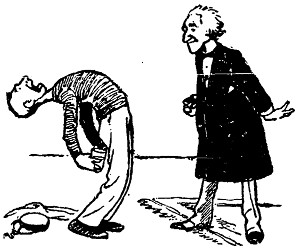
III —Penchez-vous davantage; ça coulera mieux.