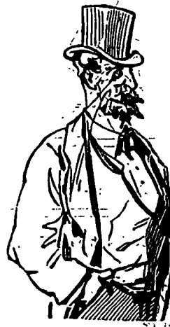
Rue St. Jacques.

—Des bons Cigares, deux pour cinq cents.