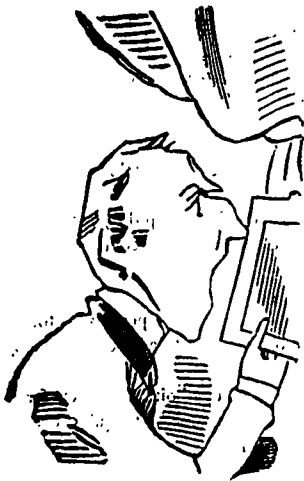
[UN VIOLENT MAL DE DINTS !

—Un vrai monsieur! Quinze cents lous de dettes.