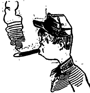
Au coin de la Place Jacques-Cartier.

Un rodeuz —Gagné $5 par semaine, chez l'épicier du coin. Imaginez-vous ce que les recettes du patron doivent souffrir.