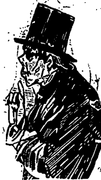
--Un abonné de l'Etendard.

Lundi, l'honorable Edmond-James Flynn a été mis en nomination dans le comté de Gaspé.