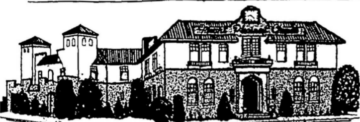
Mount Pleasant Chapel EMerald 2161