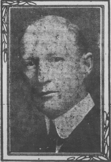
SIR CHAS. GORDON, qui occupait le fauteuil présidentiel à l'assemblée annuelle des Actionnaires de la Banque de Montréal.