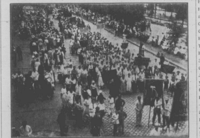
Так нині святкують на Радянській Україні Перше Травня. Зате, що згинув Перша Мая (не одна, а тисячі), нині мільйони жінок святкують це свято вільно.

— Він і не з'явився. Морфію цього не дозволить; осо-