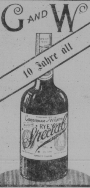
Hat das Guttheissen von drei Generationen gewonnen.