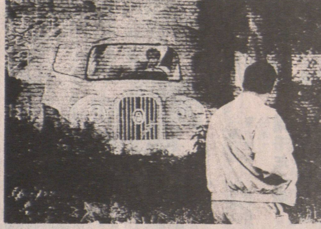
這兩隻罕有游隼，在美大頂頂棲息，獵食鴿子為生。

【三藩市訊】兩隻罕有的游隼，在美大頂頂棲息，獵食鴿子為生。這兩隻游隼在當地被發現，它們的出現引起了當地人的注意。這兩隻游隼在當地被發現，它們的出現引起了當地人的注意。這兩隻游隼在當地被發現，它們的出現引起了當地人的注意。