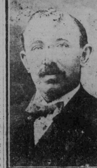
Hon. J. H. Thomas.

Gruvornas svarta arbetarhår har ofta varit invecklad i omfattande strider med arbetsgivarna. Vid 1921 års stora kolgruvstrejk i England, förlorades omkring 75 miljoner dagsverken, vilket då ansågs slå alla föregående rekord, men de dagsverken,