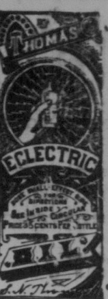
Dr. Thomas Electric Oil