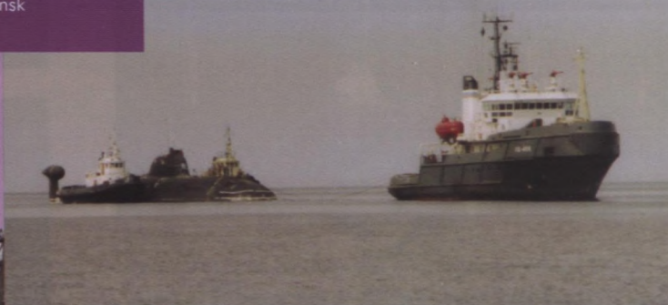
Sous-marin désaffecté toué vers le chantier Zvezdochka par un remorqueur principal et des bâtiments auxiliaires