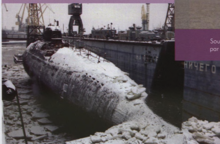
Poupe du sous-marin désaffecté n° 608 en cale sèche