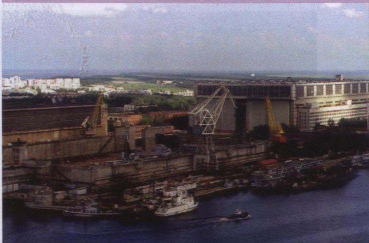
Vue aérienne du chantier Zvezdochka à Severodvinsk