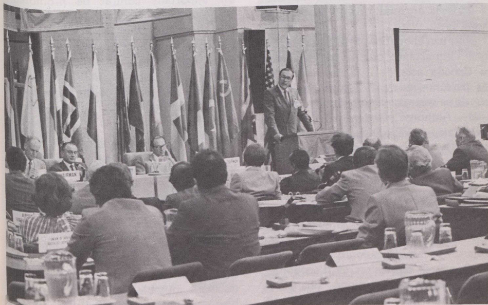
Le secrétaire administratif de la Commission économique pour l'Europe (CEE), M. Sahlgren s'adresse à l'Assemblée, lors de la 44 e session du Comité de l'habitation, de la construction et de l'urbanisme qui avait lieu à Ottawa.