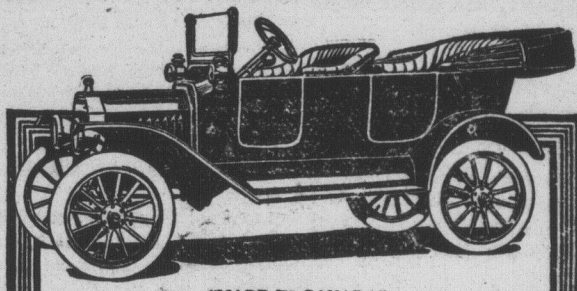
"MADE IN CANADA"