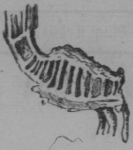
Durchschnitt der Wurzel des Wasserfischerlings.

über die Giftigkeit der verschiedenen Teile der Pflanze herrschen Meinungsverschiedenheiten. Das Gift in der Wurzel am stärksten und gefährlichsten ist, wird wohl allgemein zugegeben, doch in Bezug auf die Blätter und Samen besteht kein Zweifel.