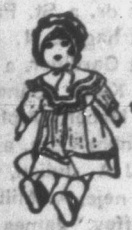
NYOLC teljes sorozat kártyáért