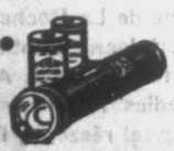
ÖT teljes sorozat kártyáért