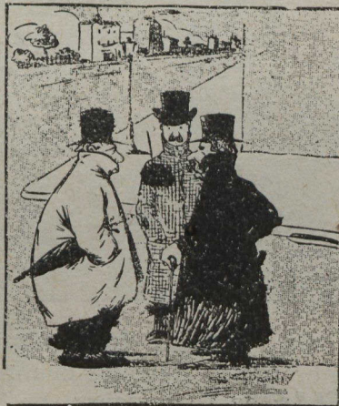
LE CONFLIT RUSSO-JAPONAIS

— L'armée régulière chinoise se compose de 320,000 hommes. Mais, en plus, il y a l'armée de l'empereur qui compte 650,000 hommes. Les fantassins reçoivent $1.20 de solde par mois, mais ils doivent pourvoir eux-mêmes à leur nourriture. La cavalerie reçoit $3.00 par mois, mais elle doit fournir le fourrage des chevaux et, quand un cheval meurt, le cavalier est tenu de payer son remplaçant sur sa solde.