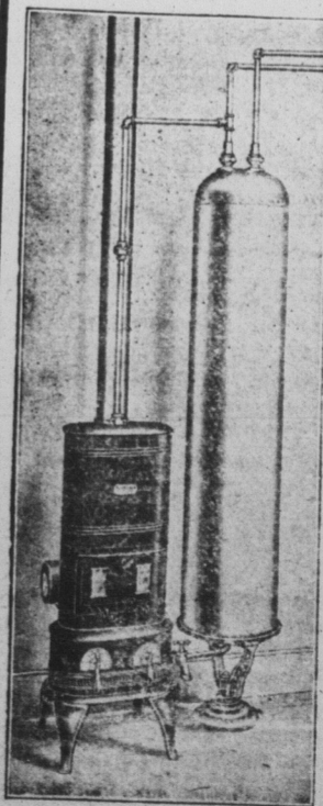
Chauffeur Automatique McClary, pour l'eau

Nous avons aussi une très belle ligne d'outils pour menuisier à des prix qui vous étonneront.