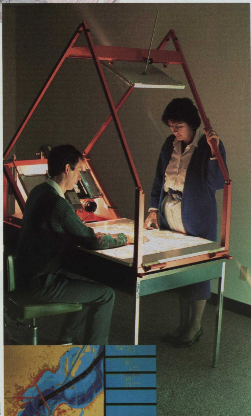
Gregory Geoscience Limited

La cartographie hydrographique reflète également l'approche innovatrice du Canada. Par exemple, l'industrie canadienne a mis au point des technologies et des systèmes d'exploitation en temps réel de l'affichage de cartes électroniques à bord des navires, permettant une navigation précise la nuit, dans les cours d'eau encombrés, et dans toutes les conditions météorologiques. Des cartes électroniques sont déjà installées à bord des traversiers de la Colombie-Britannique et des brise-glaces de la Garde côtière canadienne naviguant dans le Saint-Laurent pour permettre l'accès à longueur d'année au port de Montréal.