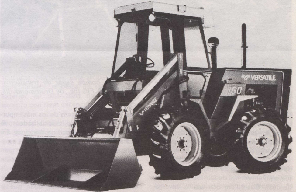
Tractor de tracción a las cuatro ruedas modelo 160 de la Versatile Farm Equipment Company de Winnipeg (Manitoba).

La industria canadiense de maquinaria agrícola se desarrolló progresivamente después del siglo XIX, habiéndose convertido en una de las primeras en el campo de la tecnología y producción agrícolas. Las empresas canadienses fabrican una línea completa de productos seguros y duraderos, adaptados a varios tipos de explotaciones agrícolas y más particularmente al cultivo en secano a gran escala.