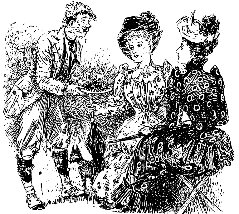
Peuante, (en sueur, et mangé par les monstres).—Mesdemoiselles, voici des mures splendides. Elles m'ont coûté deux heures de travail. Ces demoiselles.—Oh ! vraiment. Mais nous n'en mangeons jamais.

L'Intermédiaire des Chercheurs demande si l'on connaît les coutumes grotesques