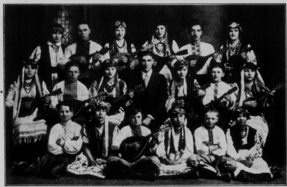
Саскатунська мандолинова оркестра відділу Секції Молоді ТУРФДім, яка з великим успіхом закінчує свою першу об'їздку по фармах Саскеченану і після 31. липня знову вїде по лінії Ростери, Принц Алберт, а потім по лінії Мефорт, Саск. і аж до Ді Пес, Ман.