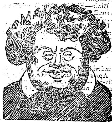
Son excellence Alexandre Dumas, père, le roi des romanciers.

o000o Ceux de nos abonnés de la campagne qui ne veulent éprouver aucun retard dans l'envoi du journal et qui auront reçu une notice, sont priés d'envoyer avant le prochain numéro le montant du trimestre strictement exigible d'avance soit 30 sous.