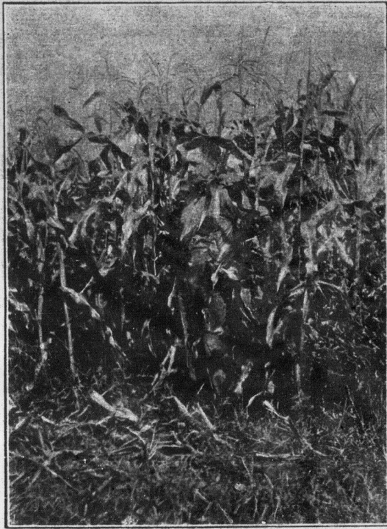
Ce magnifique champ de blé-d'inde est la propriété de M. Paul Comtois, B.S.A. de Pierreville Cté Yamaska. M. Comtois pratique un système de rotation de cinq ans (Photo prise le 5 août 1925 par D. Lessard)