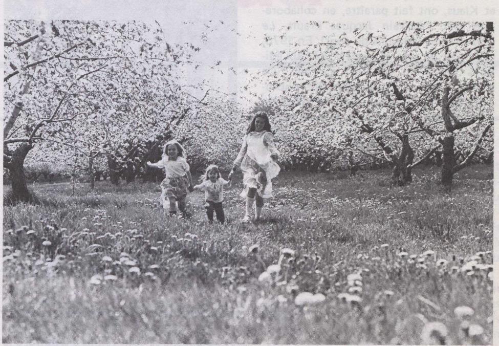
Fillettes jouant dans un verger en fleurs des cantons de l'est (Québec), 1980.

leurs oeuvres et montée par le Musée du Québec a circulé dans plusieurs musées de cette province. Sous le titre Le Québec vu par Mia et Klaus , l'exposition regroupait 40 photographies en couleurs et un diaporama.