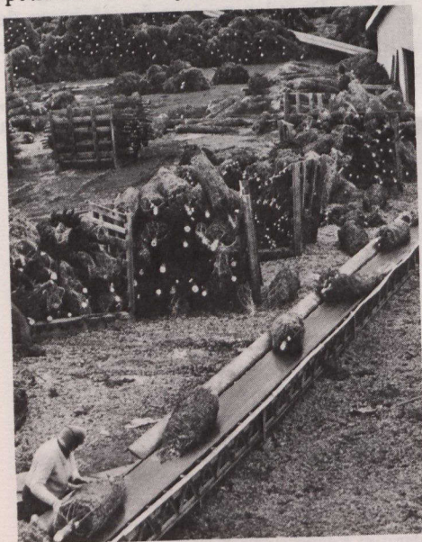
Il y a 128 ans, un arbre de Noël était illuminé pour la première fois au Canada. La Nouvelle-Écosse est la province canadienne qui en produit le plus grand nombre.

Au Québec, Noël s'habille de ferveur religieuse car, pour les Canadiens français, c'est un jour sacré et non un temps de réjouissances profanes, celles-ci étant réservées à la veille du Nouvel An. Dans les immenses étendues du Nord-Est du Québec, Noël atteint une multitude de villages pittoresques blottis au pied des collines enneigées. C'est d'abord la messe de minuit, puis le réveillon en famille aux petites heures du jour.