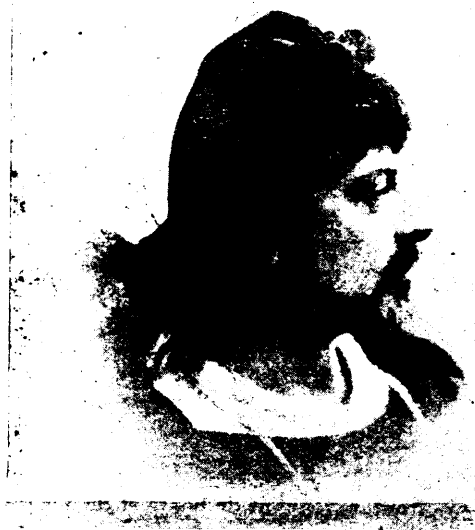
MOUNET-SULLY dans Hamlet

Irving s'est montré à nous sous les traits d' Hamlet , chef-d'œuvre de l'immortel Shakespeare, et de Thomas Becket , drame assez médiocre du grand poète Tennyson, sauvé du naufrage par le grand tragédien. Nous avons pu voir Mounet-Sully dans Andromaque , de Racine, Hernani et Ruy Blas , de Victor Hugo, Edipe-roi de Sophocle, et ce même Hamlet , dans lequel le tragédien anglais a remporté tant de triomphe.