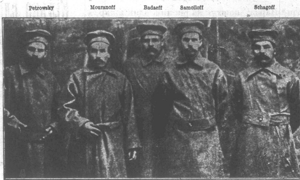
Die für den internationalistischen Kampf gegen den Krieg nach Sibien verbannten Dumaabgeordneten Sozialdemokraten (Bolschewiki) im Arrestantenkleide. Les députés social-démocrates (Bolschéviki) de la Douma d'empire, déportés en Sibirie pour leur action internationaliste contre la guerre — en habits de galérien. The social-democratic members (all — bolsheviks) of the Duma sent to Siberia for their internationalistic propaganda against war.

Соціалдемократичні послы (всі — большевики) російської Думи, заслані на Сибір за їх интернаціональну пропаганду проти війни. Від лівої руки до правої сто- ять: Петровський, Муранов, Бадаєв, Самойлов і Шагов.