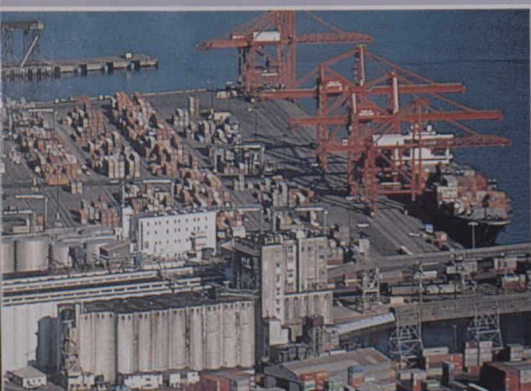
En 1994, plus de 64,6 millions de tonnes de marchandises d'exportation et d'importation sont passées par les installations portuaires de Vancouver. Le port, de loin le plus important du Canada, offre une vaste gamme de services de construction navale, de réparation de navires et de soutien.

et les loyers pour les bureaux y coûtent 5 fois moins cher qu'à Singapour et 10 fois moins cher qu'à Hong Kong et au Japon. ♦