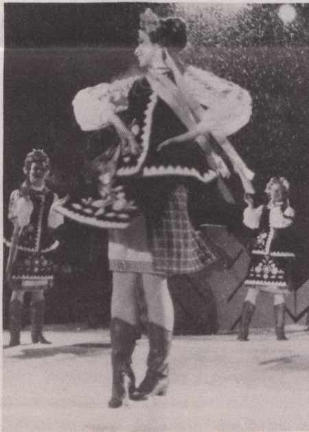
Bailarines ucranianos en acción.

El Winterlude se inicia en Dows Lake con fuegos artificiales, veladas musical y una exhibición de patinaje sobre hielo,