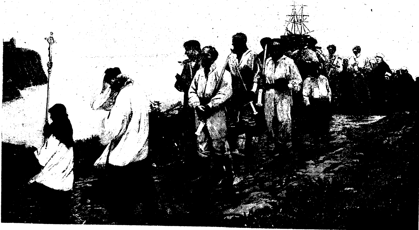
SALON DE 1894.—LE VŒU, TABLEAU DE M. DEMAREST

La ligne, par insertion - - - - - 10 cents Insertions subséquentes - - - - - 5 cents Tarif spécial pour annonces à long terme