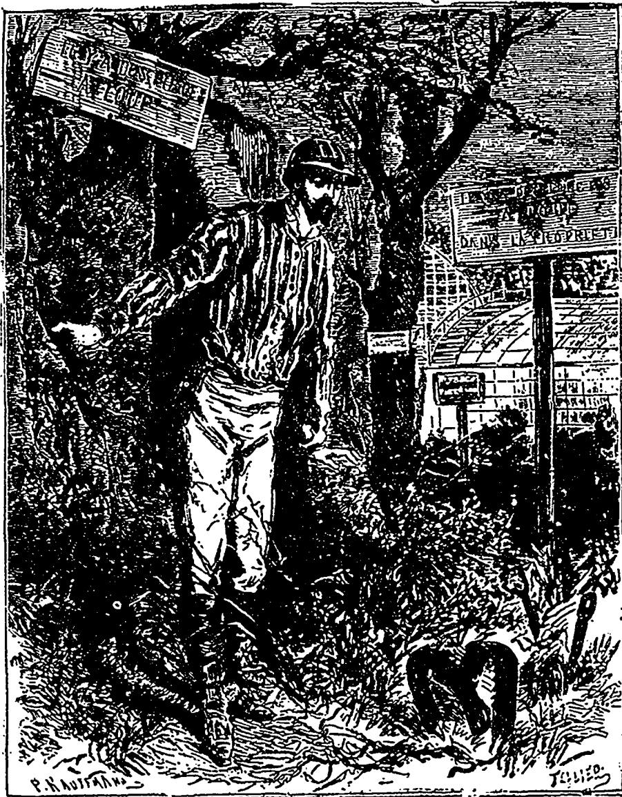
Rouillés, détendus, hors d'usage, oubliés par un jardinier négligent. (Page 292).

DEUXIÈME PARTIE DE "LE TERRIBLE AVENTURIER."