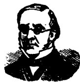
MARQUE DE COMMERCE