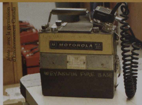
| Motorola PT 300

Pour plus de renseignements sur le programme des radios pour la faune, consultez l'EnviroZine d'Environnement Canada : www.ec.gc.ca/envirozine/french/home_f.cfm