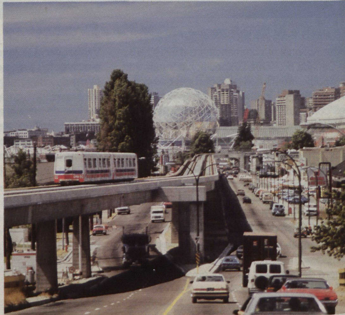
Le nouveau VRRT reliera l'Expo aux banlieues de Vancouver.